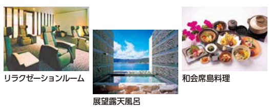
リラクゼーションルーム

早朝、名瀬に到着した際の朝食対応 1泊2朝食付 絶景オーシャンビューのリゾートホテル 奄美山羊島ホテル