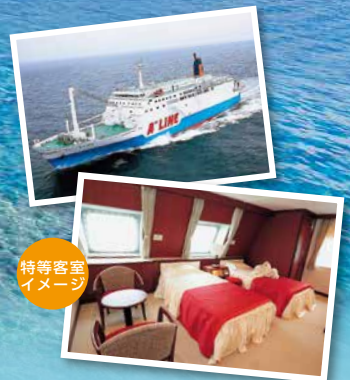
特等客室イメージ