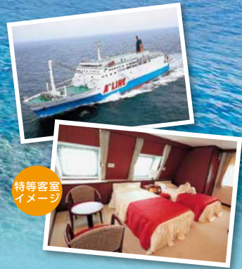
特等客室イメージ